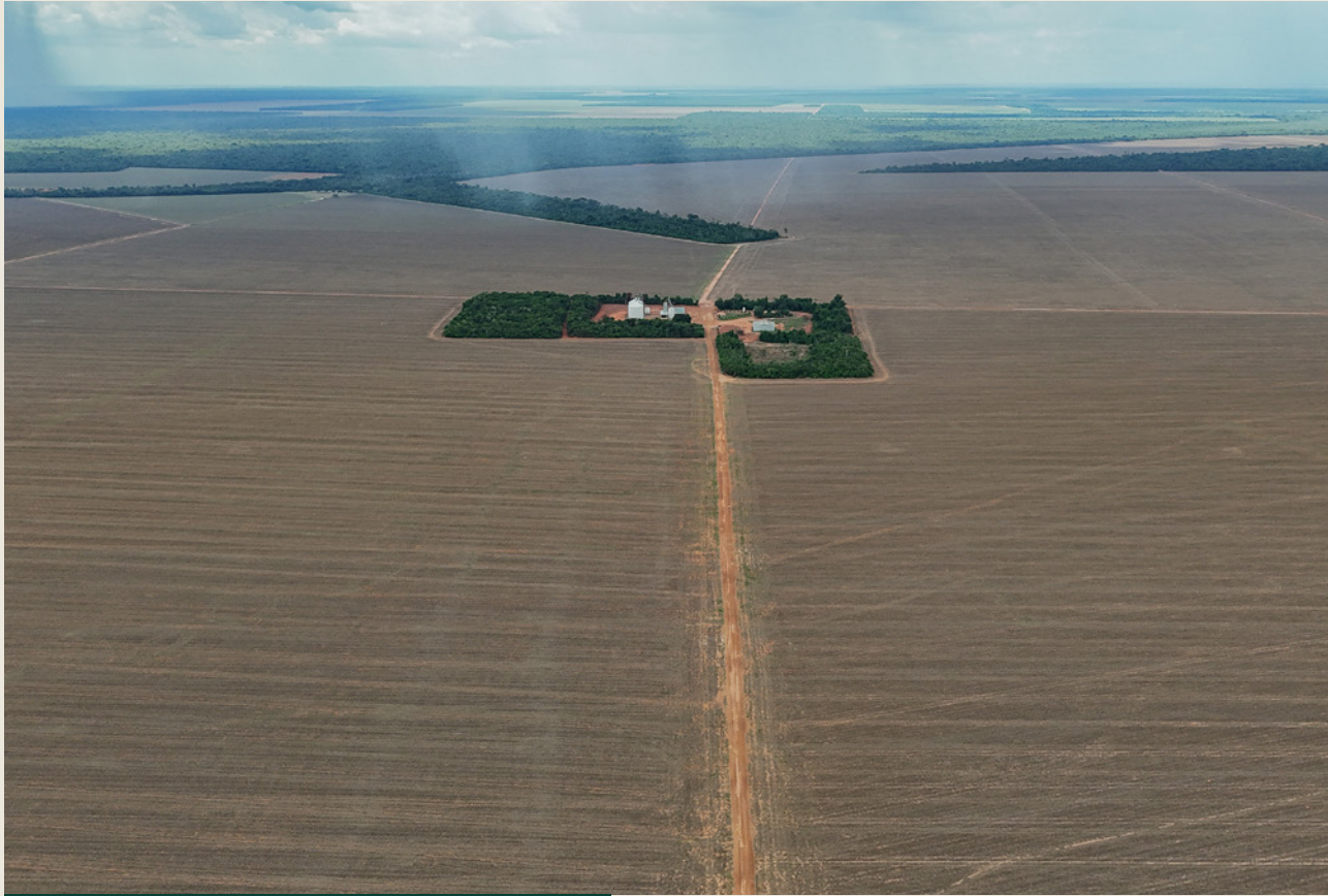
Fazenda dans l'Etat du Mato Grosso.