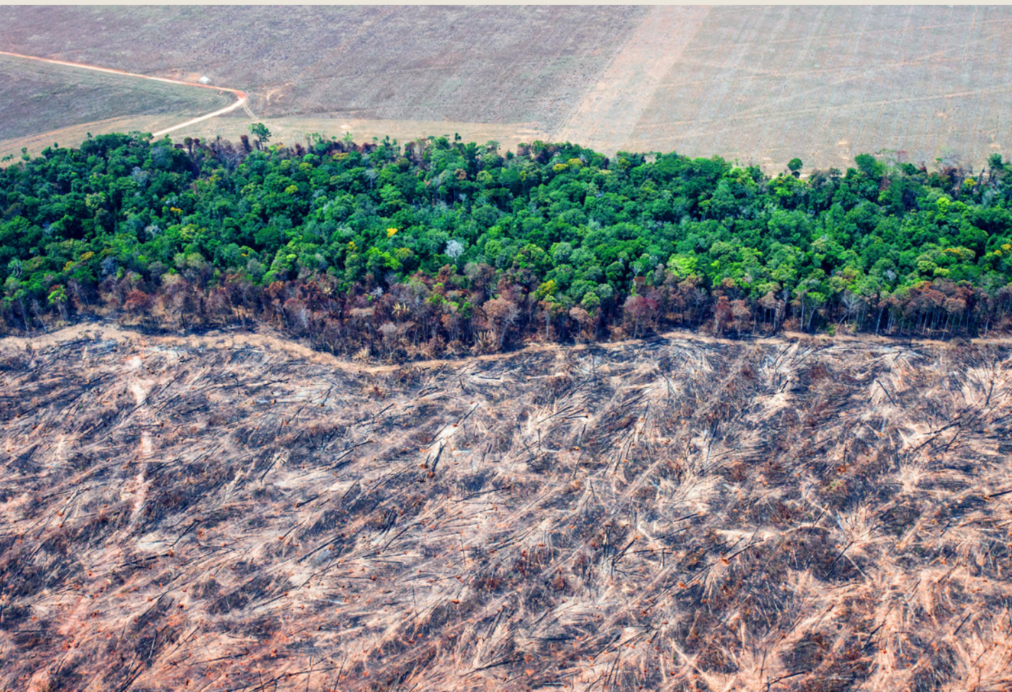
Déforestation dans le Mato Grosso.

La Société Générale et BNP Paribas devraient donc cesser tout nouveau financement de Bunge et Cargill pour respecter leurs objectifs, étant donné la forte exposition de ces négociants au risque de déforestation en Amazonie.