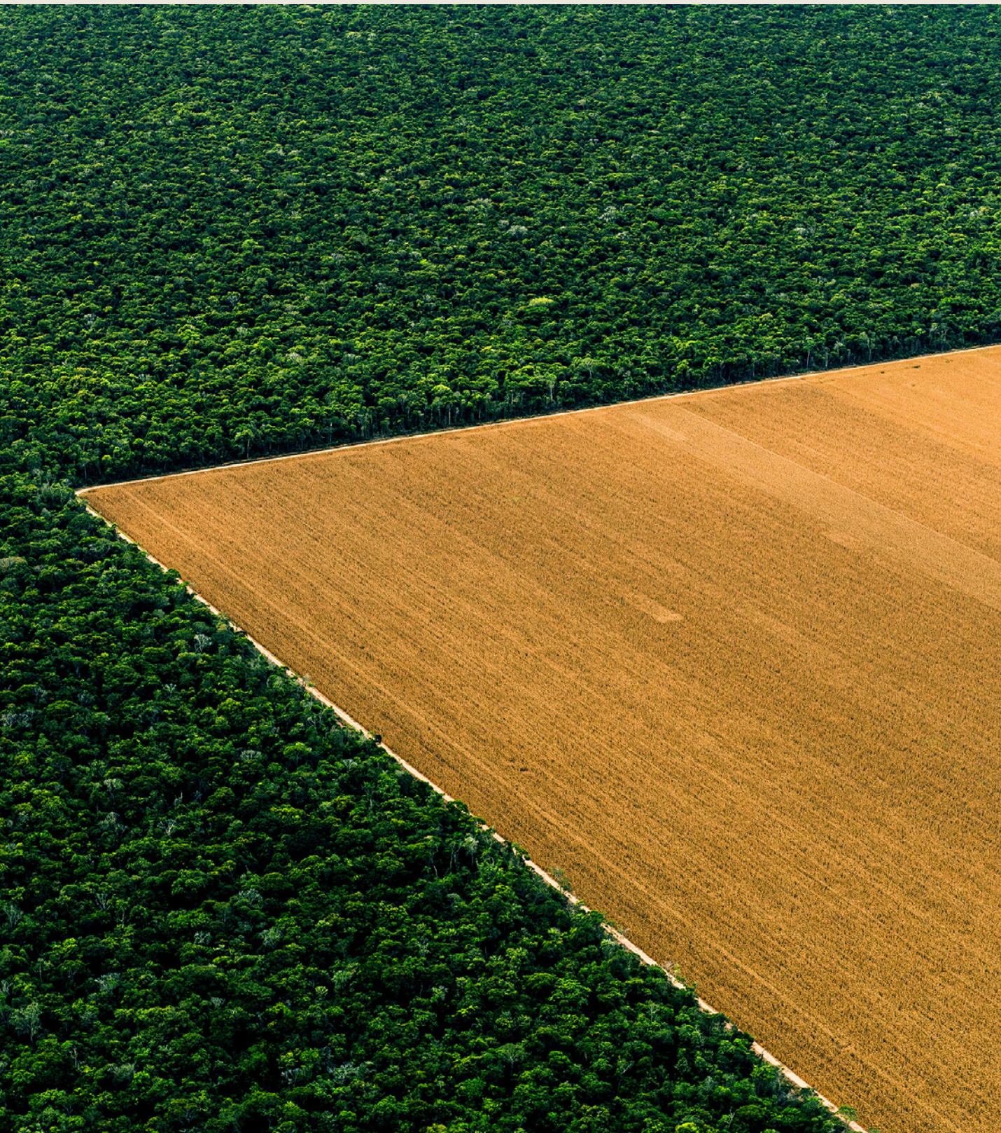
Fazenda Macaré, Querencia.