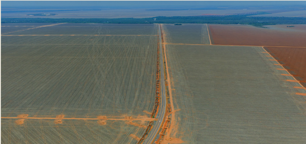
Fazenda Macaré, Querencia.

Pour compléter notre analyse, des enquêteurs mandatés par Canopée se sont rendus en octobre 2025 sur la ferme Macaré, à Querencia, dans l'État du Mato Grosso. Cette exploitation typique des fermes brésiliennes a été identifiée à trois reprises depuis 2019 par les ONG Mighty Earth et AidEnvironment 19 pour des cas de déforestation 20 . Les enquêteurs ont constaté que de vastes zones, recouvertes jusqu'à très récemment d'une forêt tropicale diversifiée, sont maintenant remplacées par des champs de soja à perte de vue.