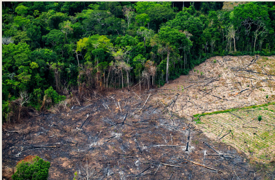
Saison des feux en Amazonie.

Notre analyse révèle que les politiques sectorielles existantes présentent d'importantes failles, qui permettent aux banques de continuer à financer des entreprises associées au risque de déforestation. L'analyse détaillée par banque et la méthodologie sont présentées en annexe.