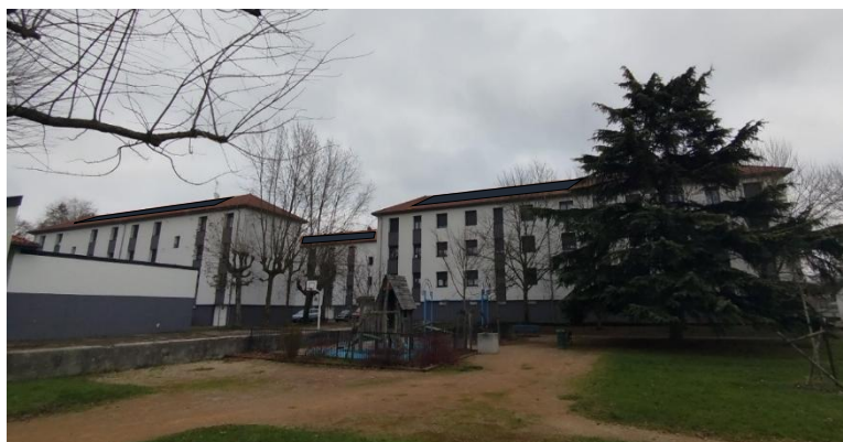
Représentation des installations solaire PV sur toiture – Résidence du Pallordet, rue des peupliers à Bourg en Bresse