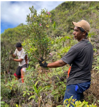
Reforestation du plateau de Te Mehani rahi, Tuihana, Polynésie française

L'Office français de la biodiversité (OFB) ouvre sa campagne annuelle de financements de micro-projets dans le cadre du programme Terres et Mers Ultramarines (TeMeUm). Cette campagne vise à soutenir la montée en capacité des acteurs de la protection et de la restauration de la biodiversité des territoires ultramarins au travers de la mise en œuvre d'actions concrètes. Les porteurs de projet peuvent candidater en ligne jusqu'au 14 avril 2026.